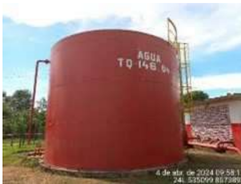
Imagem 11: Tanque de Armazenamento de água (TQ-3146-01-04)

2.1.1. TANQUE DE ARMAZENAMENTO (TQ-3146-01-04) : tanque atmosférico vertical com capacidade de 160m 3 , com 8,86m de altura e 2,80m de largura. Construído em aço carbono, sem proteção catódica, com teto fixo e sem serpentinas de aquecimento e agitadores mecânicos.