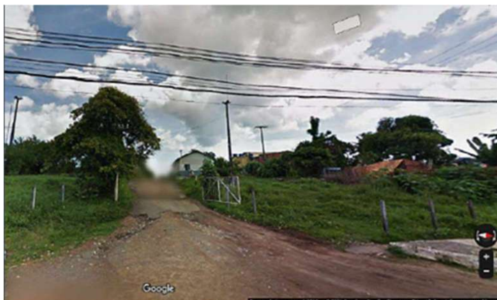
Imagem 16: acesso ao imóvel pela rua São Judas Tadeu.