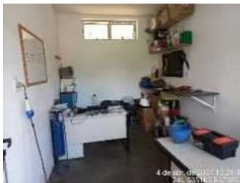
Imagem 9: Depósito de Ferramentas

1.3.6. ALMOXARIFADO : construção com um pavimento com estrutura em concreto, fechamentos em alvenaria revestida interna e externamente, com pintura sobre reboco. Teto com telhado de fibrocimento. Porta de madeira. Pisos cimentado liso.