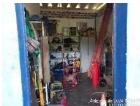
Imagem 10: Almoxarifado

1.3.6. ALMOXARIFADO : construção com um pavimento com estrutura em concreto, fechamentos em alvenaria revestida interna e externamente, com pintura sobre reboco. Teto com telhado de fibrocimento. Porta de madeira. Pisos cimentado liso.