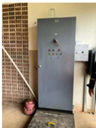
Imagem 14: Painel elétrico do sistema de combate a incêndio

2.1.4. PAINEL ELÉTRICO DO SISTEMA DE COMBATE À INCÊNDIO : painel elétrico de 440 v.