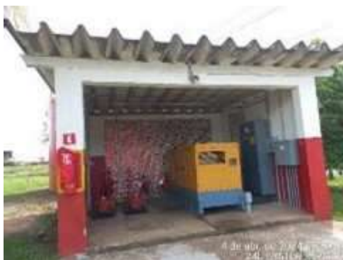
Imagem 2: Casa de bombas