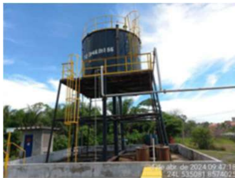
Imagem 12: Tanque de armazenamento TQ-3146-01-I-56

2.1.3. BOMBA CENTRÍFUGA DO SISTEMA DE COMBATE À INCÊNDIO : moto-bomba elétrica com potência de 150 cv.