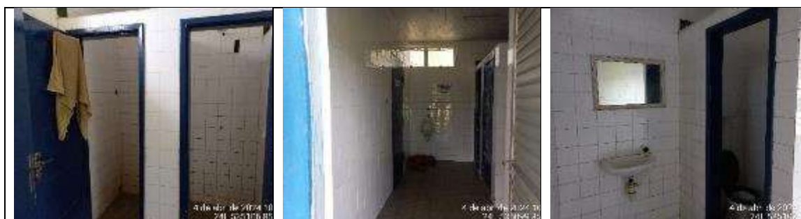
Imagens 6 a 8: Banheiro

1.3.4. BANHEIRO: construção com 10,82m 2 , com um pavimento com estrutura em concreto, fechamentos em alvenaria revestida interna e externamente, com azulejos na parede internamente e pintura externamente. Esquadrias de alumínio e vidro liso. Forro em PVC. Pisos em cerâmica.