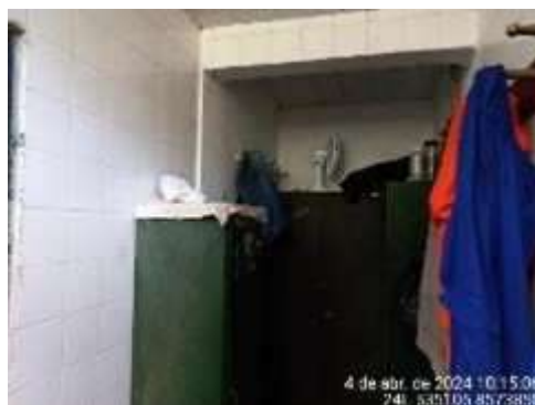
Imagem 5: Vestiário

1.3.3. VESTIÁRIO: construção com 7,23m 2 , com um pavimento com estrutura em concreto, fechamentos em alvenaria revestida interna e externamente, com azulejos na parede internamente e pintura externamente. Esquadrias de alumínio e vidro liso. Forro em PVC. Pisos em cerâmica.