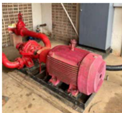
Imagem 13: Moto-bomba centrífuga do sistema de combate à incêndio

2.1.3. BOMBA CENTRÍFUGA DO SISTEMA DE COMBATE À INCÊNDIO : moto-bomba elétrica com potência de 150 cv.