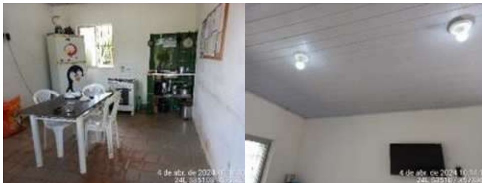
Imagens 3 e 4: Copa e Teto com forro em PVC

1.3.3. VESTIÁRIO: construção com 7,23m 2 , com um pavimento com estrutura em concreto, fechamentos em alvenaria revestida interna e externamente, com azulejos na parede internamente e pintura externamente. Esquadrias de alumínio e vidro liso. Forro em PVC. Pisos em cerâmica.