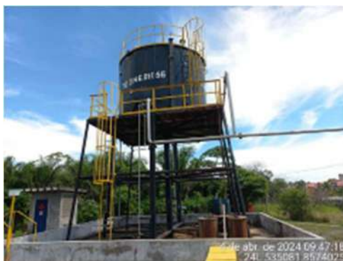
Imagem 1: Plataforma de sustentação do tanque