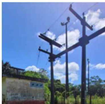
Imagem 15: Trecho da rede elétrica da Estação Itaparica